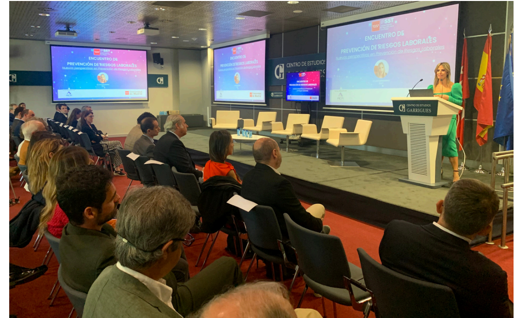
La secretaria general del IRSSST presenta un acto organizado por el Instituto y AICA.