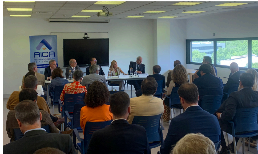
El presidente y secretario general de AICA con la alcaldesa de Alcobendas