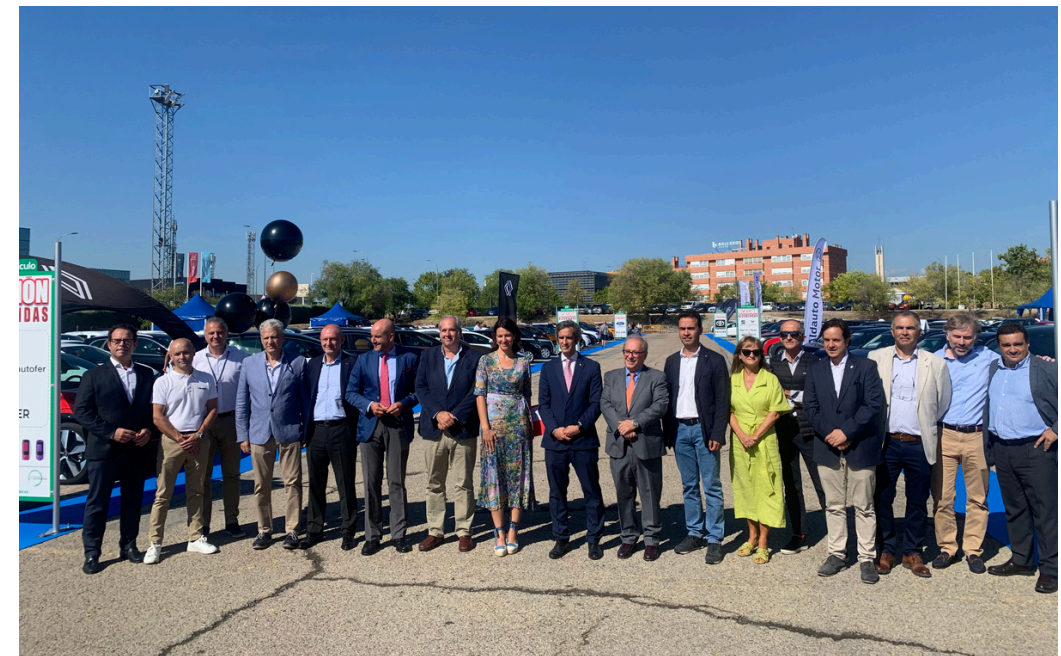
El presidente y el secretario general de AICA con la directora general de Comercio, Consumo y Servicios de la Comunidad de Madrid.