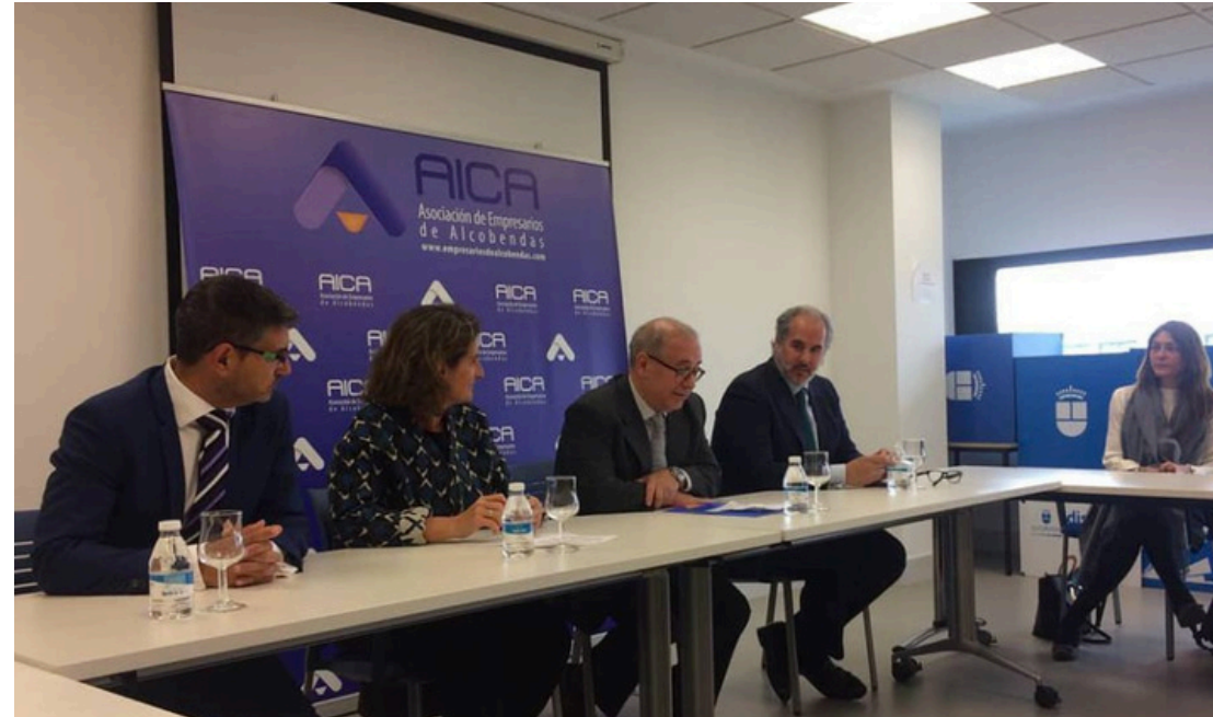
El presidente y el secretario general de AICA con Teresa Ribera, vicepresidenta del Gobierno.